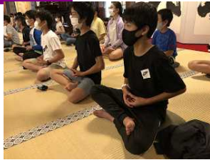
【 ザ・禅 】