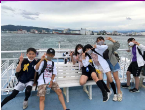
【 船旅 】