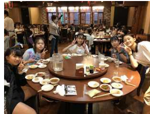
【 中華街 】