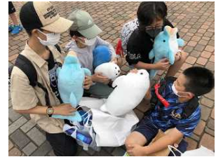
【 夢の跡 】